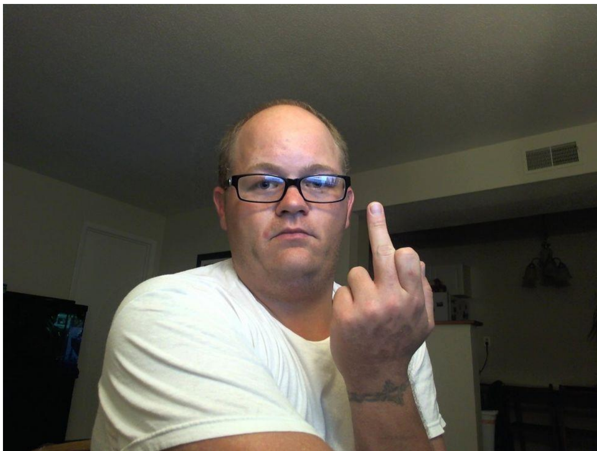
«The Middle Finger Response» de Guido Seigni

next.libération.fr /culture-next/2015/10/15/nous-sommes-dans-l-ere-selfie-10-l-ere-20-et-plussuivront_